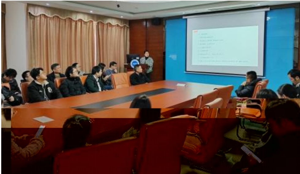
图 员工专业技 培