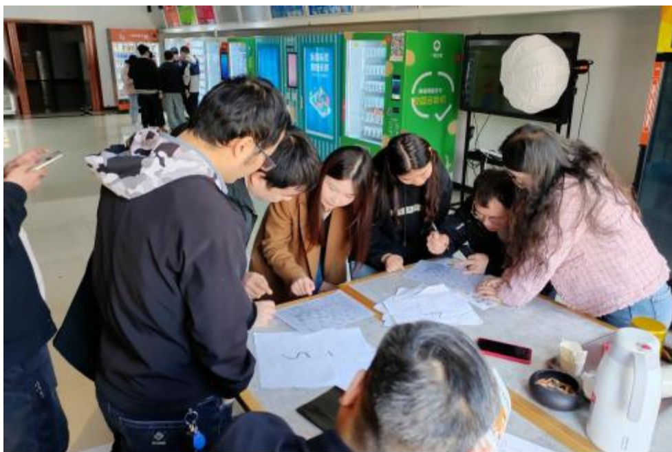
图 卓 团 建 共