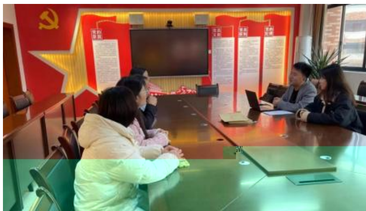
图 企开展学术 交 会